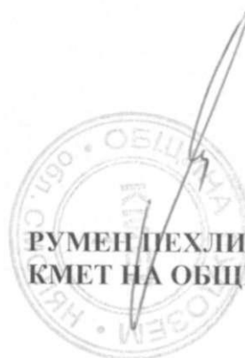
РУМЕН ПЕХЛИВАНОВ КМЕТ НА ОБЩИНА РУДОЗЕМ